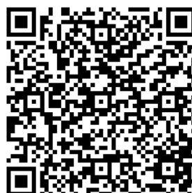
Histórico dos debates e deliberações da categoria